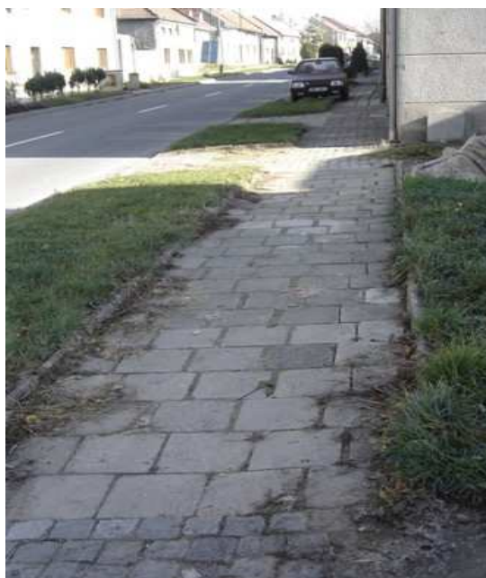
Chodník zbrojnice – Hliník