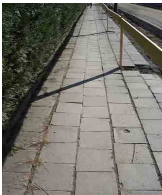
Chodník zbrojnice – nádraží